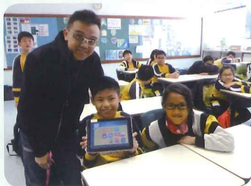
老師和學生都對「eeLerner數碼教育操作系統」十分滿意呢！

近代科技的革新，往往源自一些標準化技術平台的誕生，就像個人電腦等等的智能產品，都是在一些標準化的操作系統和格式下成長。一套完整的「eeLerner數碼教育操作系統」亦因而誕生，配合不同的教學需要，例如「互動教室」、「電子書包」、「自動化評核系統」、「同儕協作學習」、「簡易校本教材制作」等等。