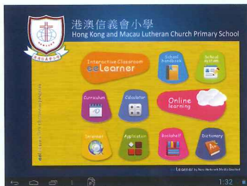
港澳信義會小學的「eeLerner數碼教育操作系統」介面。