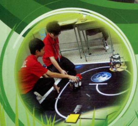
第七屆創協盃 2012 創意科技機械人大賽