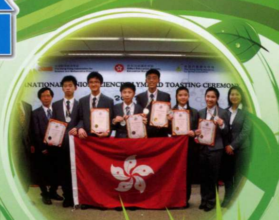
「國際初中科學奧林匹克」 香港隊獲六面獎牌