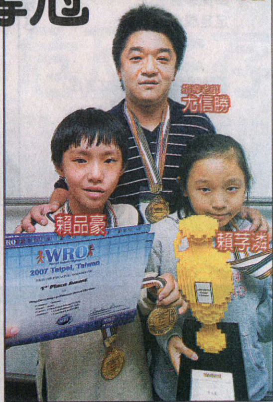
創意組第3名 桃園成功國小