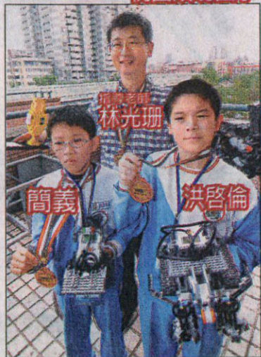
2007世界盃國際奧林匹克機器人大賽，我學子表現亮眼！頒獎典禮昨天於台大體育館舉行，指導老師與得獎學生開心地拿著獲獎作品合影。

〔記者謝文華／台北報導〕電動迷設計出最具創意機器人！「二〇〇七世界盃國際奧林匹克機器人大賽」成績昨天揭曉。創意類國小組奪冠者是香港四名小六學童，他們合力完成能撲滅核電廠火警的機器人組，包括恐龍、蜘蛛人、機器狗等六種機器人，以電玩、電影情節鋪陳出生動故事。