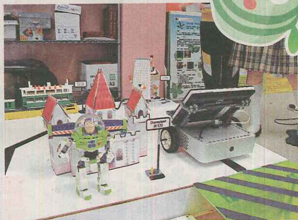
▲供「機械導遊」行走的「迷你香港」是以LEGO塑膠積木和摺紙製作而成。