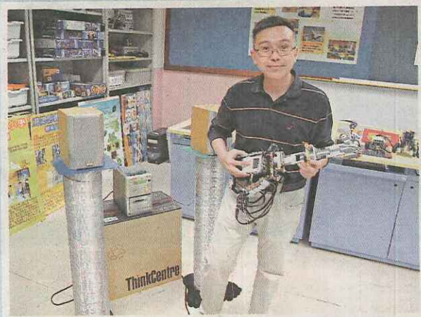
▲程主任展示該校另一件得獎作品「電子音樂製作器」。