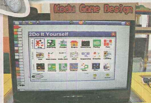
▲校方展示初小同學製作的多款電腦小遊戲。