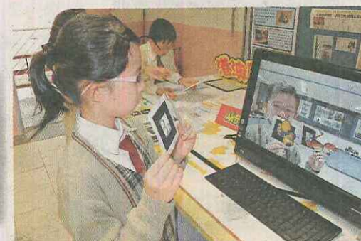
▲老師應用「擴增實境技術」使課堂變得生動，讓同學更投入學習。