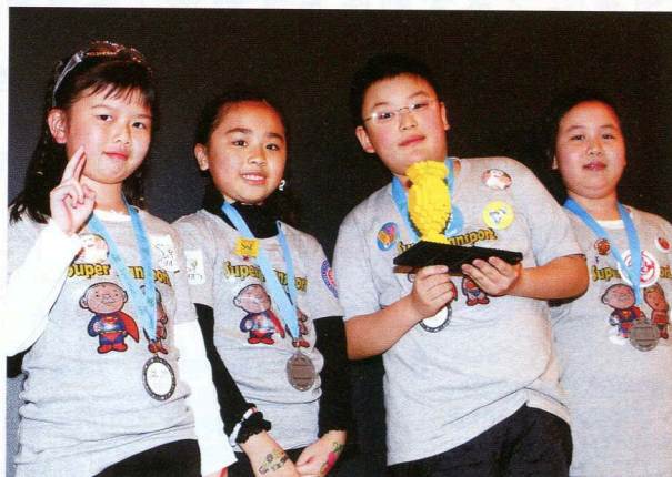
恭喜港澳信義會的得獎同學！